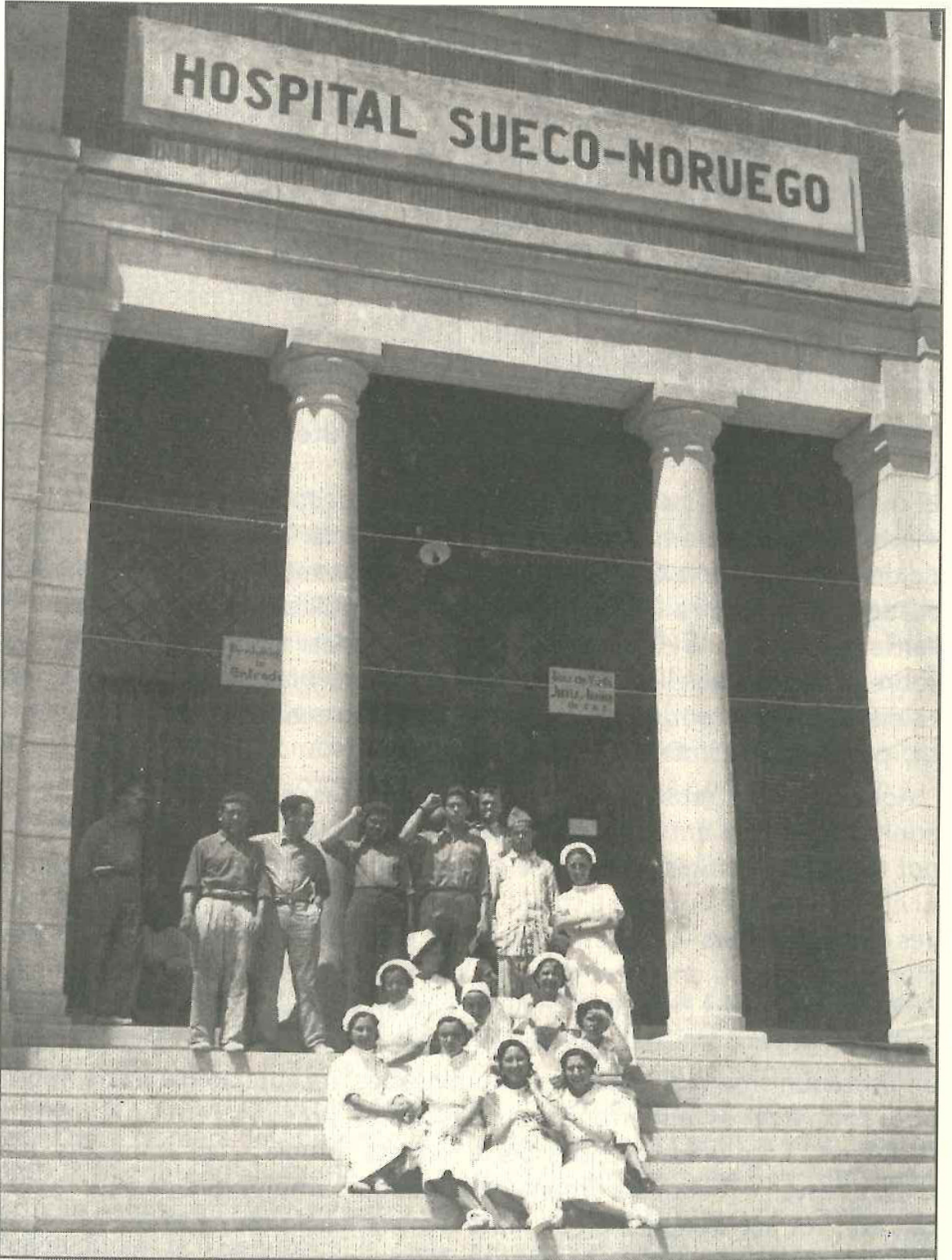
Façana de l'Hospital Suec-Noruec.

Alcoi un hospital complet per a soldats que queien ferits en combat: van portar roba, medicaments, aliments, material quirúrgic, personal sanitari, etc. L'hospital, conegut com "Hospital Sueco-Noruego", constava de 700 llits i es va instal·lar en l'edifici de l'Escola Industrial d'Alcoi, en l'actual Passeig d'Ovidi Montllor.