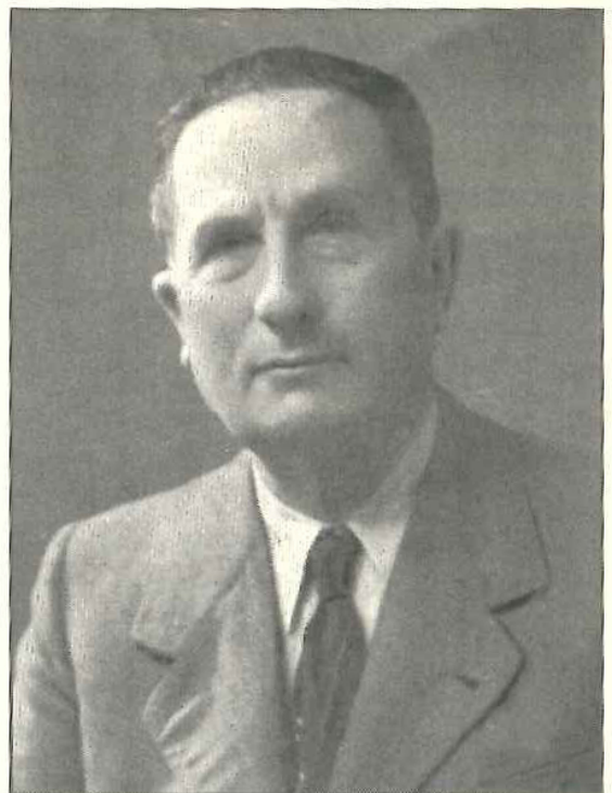
Evaristo Botella, alcalde d'Alcoi afusellat en finalitzar la guerra.