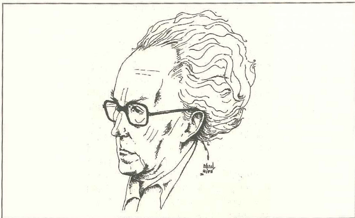
Retrat del compositor Carlos Palacio realitzat per Miguel Abad Miró .