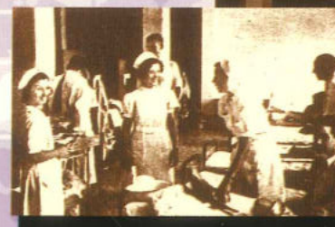
Infermeres alcoianes a les sales de l'Hospital.