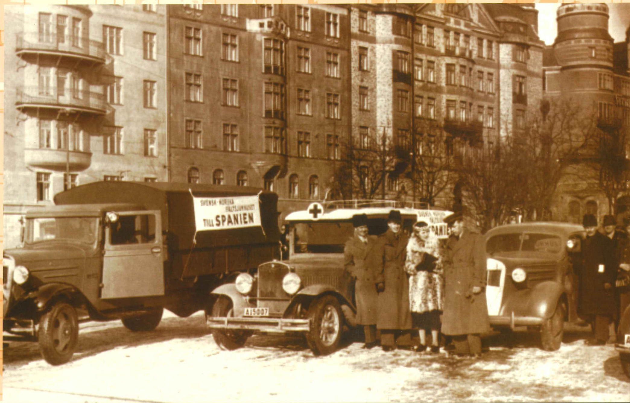
Comboi d'ambulàncies amb destinació a Espanya.