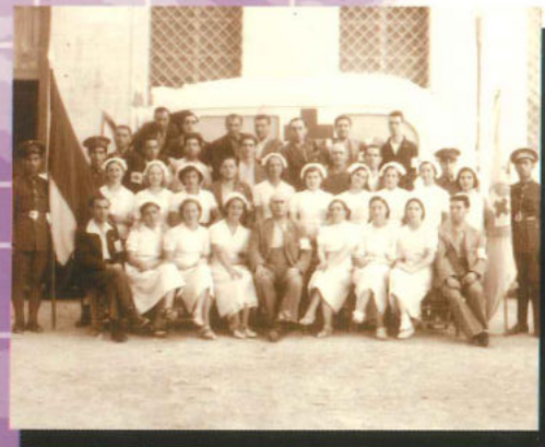
Infermeres de la Creu Roja d'Alcoi destinades a l'Hospital "sueco-noruego".