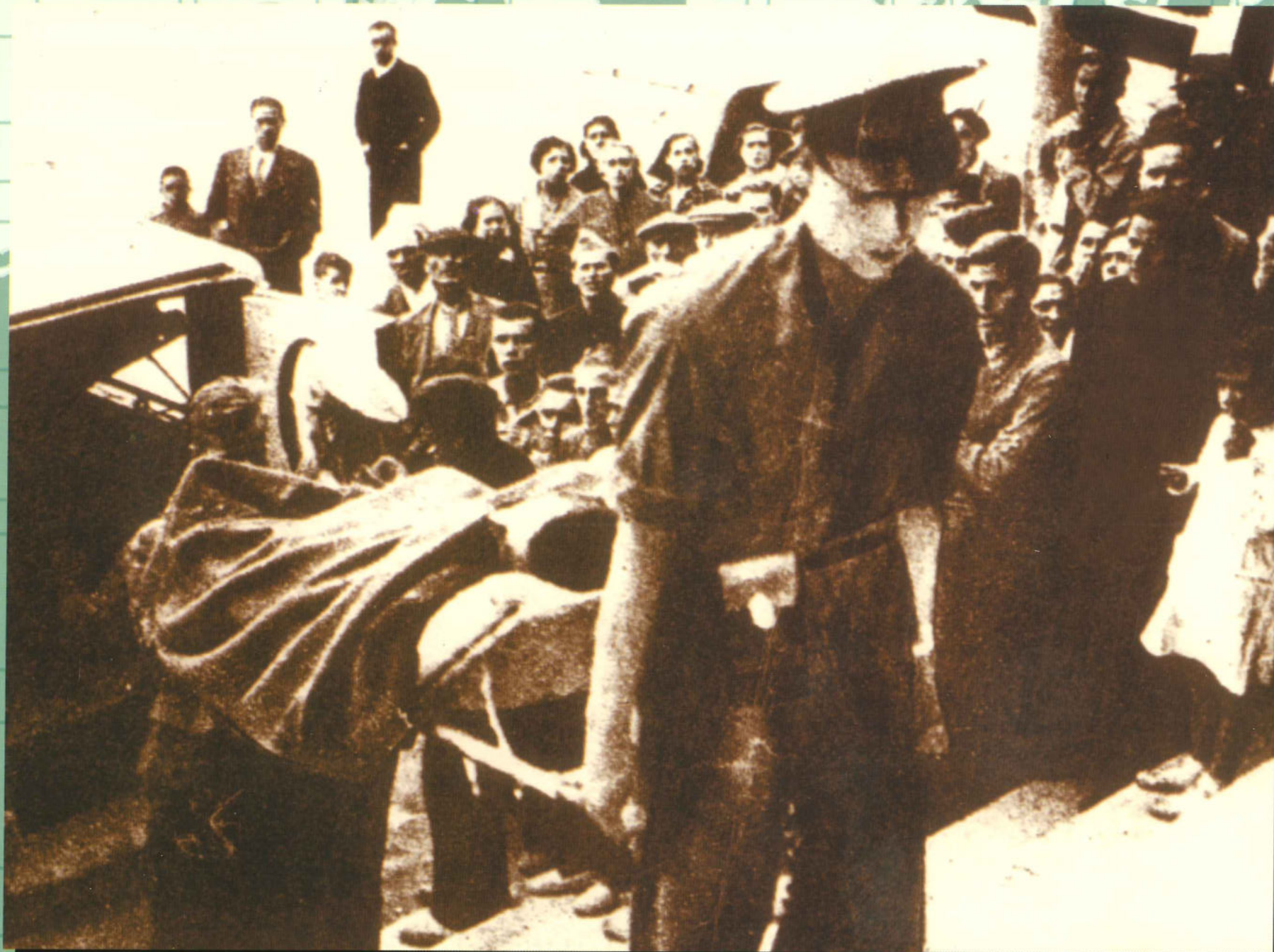
Ferit de guerra ingressant en l'Hospital "sueco-noruego". Molts d'ells procedien dels fronts d'Andalusia i d'Extremadura.