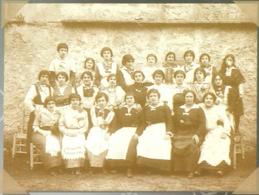
PALACIO GARCIA HERNAIZ