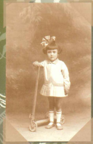
Unchis Alcoy D-D-E-E-E-E